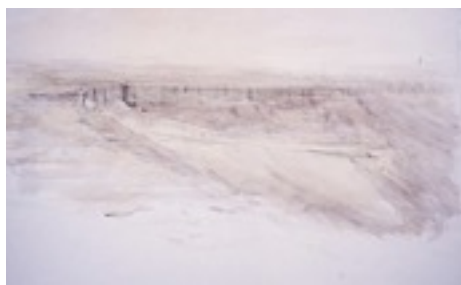
Ofer Lellouche, « Judean Hills, Landscape »